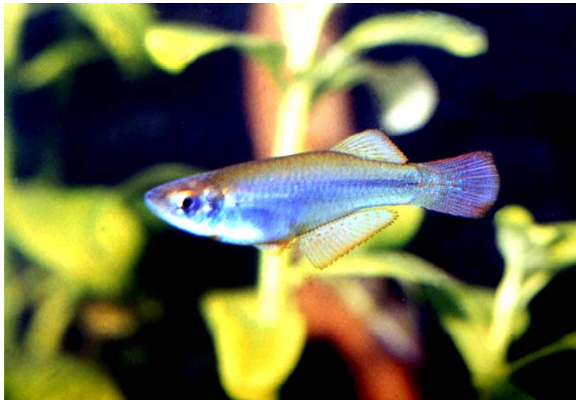
Procatopus spec. „irridaeus“