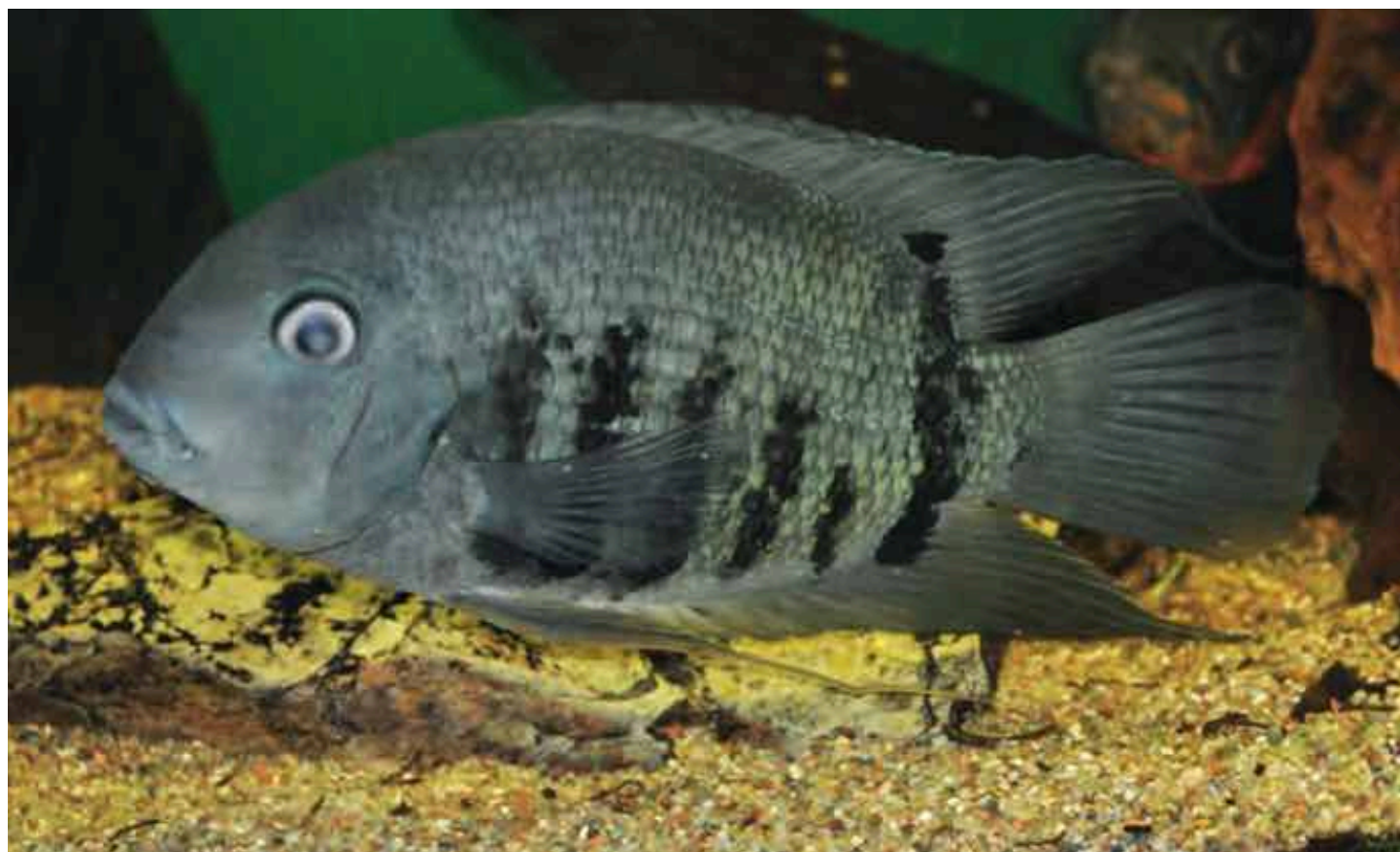
Heros sp. „Blau“. Bei diesem Exemplar erscheint die 7. Vertikalbinde (Heckels Zählung) durch ein überlagertes Muster verkürzt. Tatsächlich reicht sie bei diesem Tier jedoch bis zur Rückenflosse.

The type specimen of the Neotropical Cichlid fish taxon Heros severus HECKEL, 1840 curated in the NWM is analysed. The taxonomic history and nomenclature of the taxon is briefly reviewed. The specimen NMW 17638 is recognized as the type of Heros severus HECKEL, 1840. The specimens NMW 17354 and NMW 17656 listed as syntypes are actually types of other Heros species group taxa described by HECKEL. A comparative description of the bar pattern and other critical characteristics of the name-bearing type specimen (NMW 17638) is provided as a first step to resolve the taxonomic status of Heros severus . It is possible that the type specimen NMW 17638 does not represent the mouthbrooding Heros . A comprehensive revision of the genus is required to obtain an unambiguous clarification of its taxonomy.