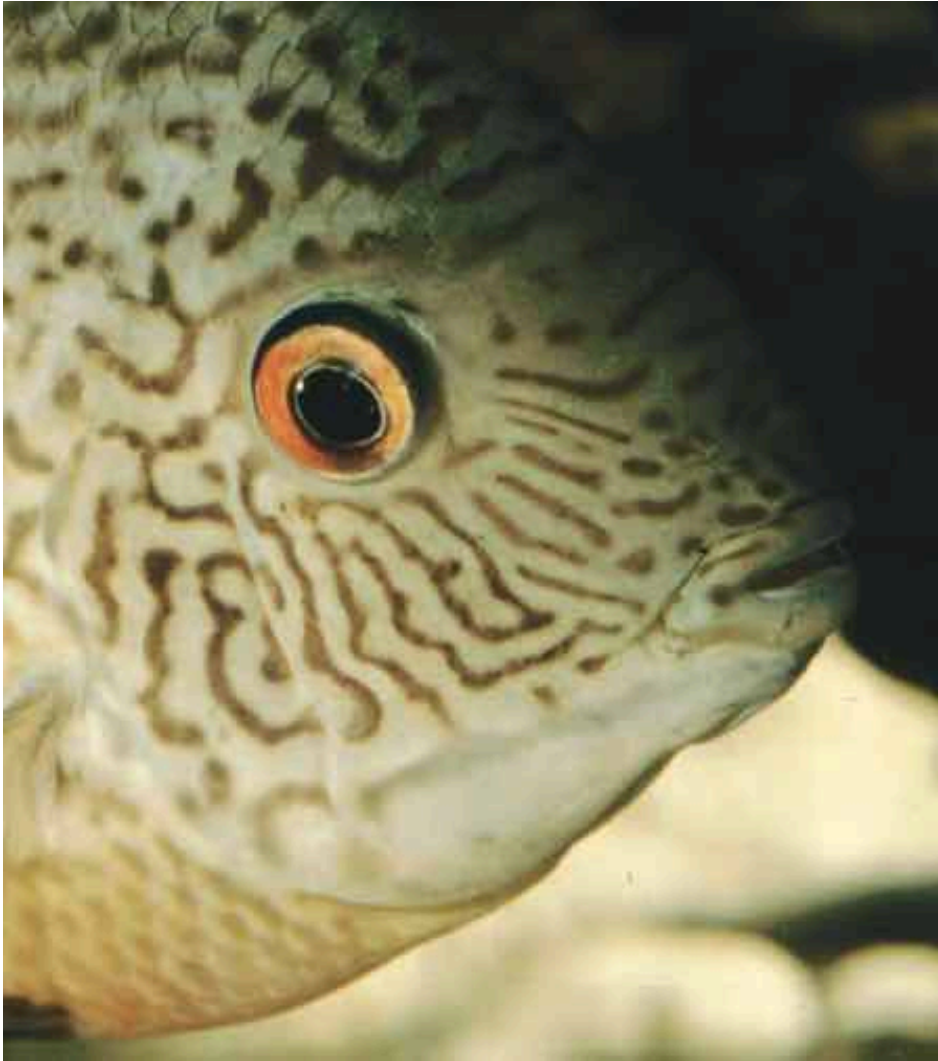
Heros sp. „Französisch-Guayana“. Im Gegensatz zum larvophilen Maulbrüter zeigen die Männchen der meisten übrigen Augenfleckbuntbarsche ein Linienmuster auf den Kopfseiten.