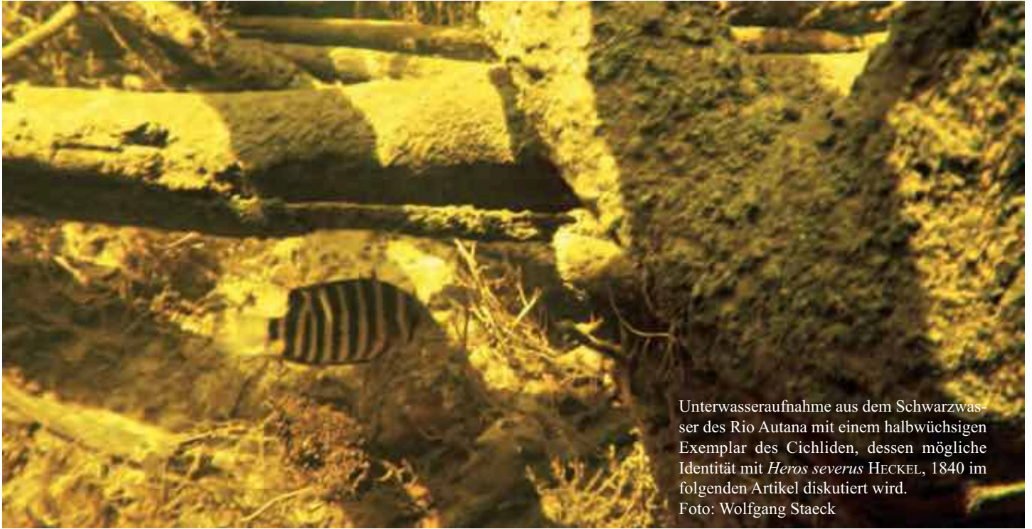
Unterwasseraufnahme aus dem Schwarzwasser des Rio Autana mit einem halbwüchsigen Exemplar des Cichliden, dessen mögliche Identität mit Heros severus HECKEL, 1840 im folgenden Artikel diskutiert wird.