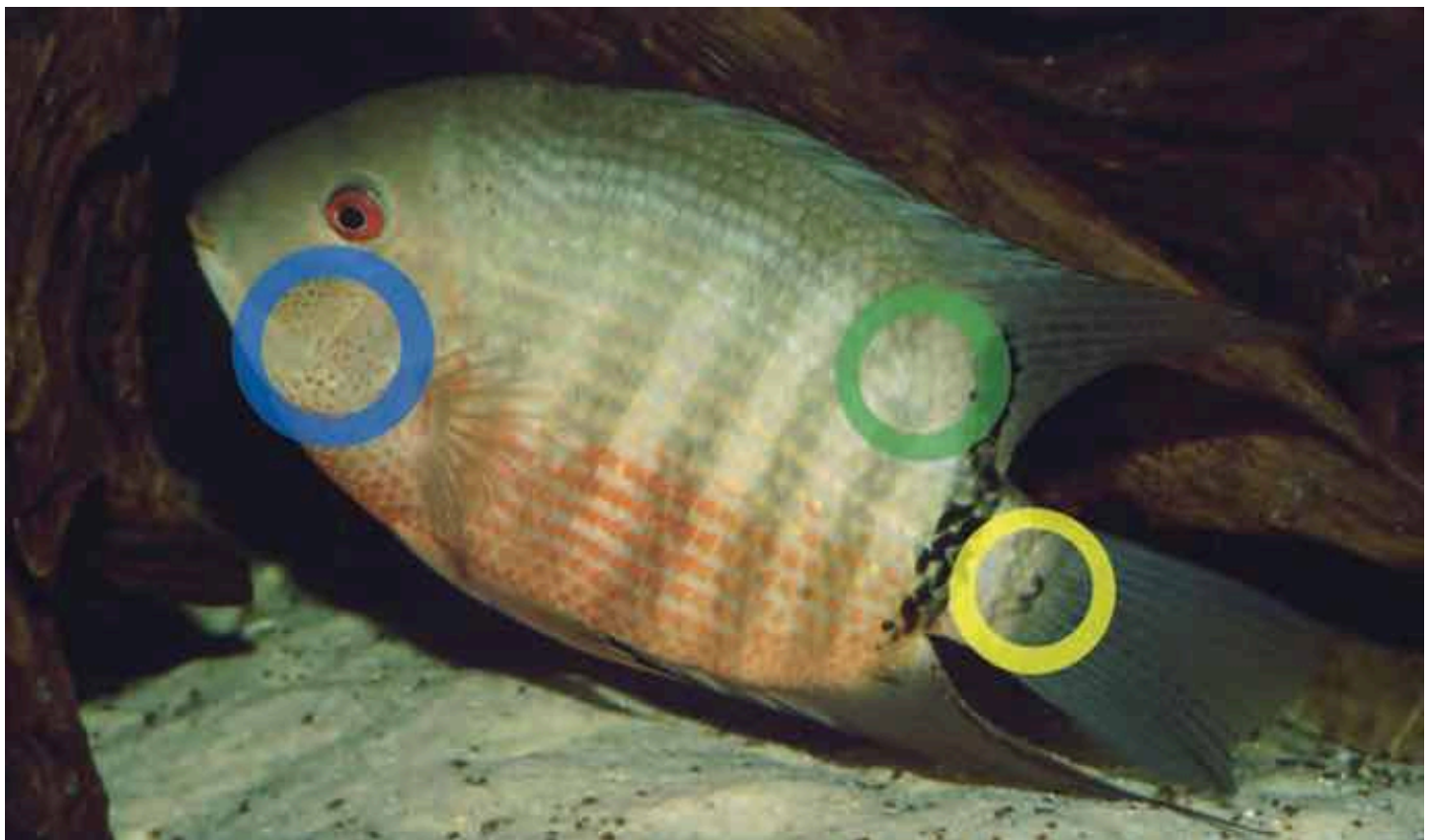
Arttypische Merkmale im Zeichnungsmuster, die den „Maulbrüter“ von den übrigen unterscheiden, sind die kleinen, dunklen Punkte auf den Kiemendeckeln (blauer Kreis) und der getrennte Schwanzwurzelfleck (gelber Kreis). Der grüne Kreis kennzeichnet die 7. Vertikalbinde, die in Einzelfällen auch beim „Maulbrüter“ verkürzt sein kann. (Markierungen: Ingo Schindler)

Aus HECKELS (1840) Ausführungen wird klar, dass er die Beschreibung nur auf ein einziges Exemplar gründet. Die Konsultierung der Karteikarten (durch STAWIKOWSKI) des Naturhistorischen Museums Wien (NMW) ermöglicht es, NMW 17638 als Typus von Heros severus HECKEL, 1840 zu identifizieren. Die beiden in KULLANDER (2003) als weitere Syntypen erwähnten Exemplare NMW 17354 und 17656 sind hingegen die Typen anderer von HECKEL (1840) beschriebener Taxa. Ein Vergleich der Körperkontur von NMW 17638 und einer mittels der von HECKEL (1840) veröffentlichten