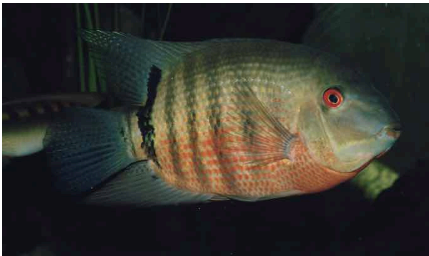
Ausgewachsener „Maulbrüter“- Heros aus dem Orinoko-Gebiet. Im Gegensatz zum Holotypus von Heros severus besitzt dieser einen erkennbaren Schwanzwurzelfleck und eine bis zur Rückenflosse reichende 7. Vertikalbinde.

Bei Betrachtung der Zeichnung des Typusexemplars von Heros severus wird deutlich, dass der Schwanzwurzelfleck nicht vom Balken auf dem Schwanzstiel abgesetzt ist. Die 7. Vertikalbinde (HECKELS Zählung) ist verkürzt und reicht nur etwas über die untere Seitenlinie. Die Lippen des Exemplars sind relativ dick. Die Körperhöhe beträgt circa 52% der Standardlänge. Die übrigen Typenexemplare der von HECKEL